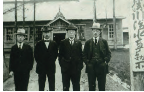
十勝川治水事務所（昭和2年頃）

そこで、開拓の中心地域である茂岩から西帯広までの延長56kmにも及ぶ区間に堤防、新水路掘削、護岸工事を実施するための計画が立てられました。大正12年、十勝川治水事務所が開設（現在の帯広市大通南1丁目）され、本格的な治水事業が開始されました。