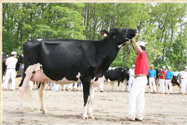
帯広ブラック&ホワイトショウ（6月上旬）