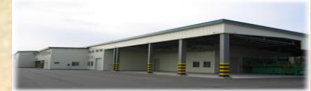
種子馬鈴薯選別貯蔵施設