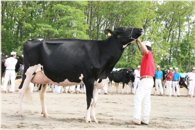
帯広ブラック&ホワイトショウ（6月上旬）