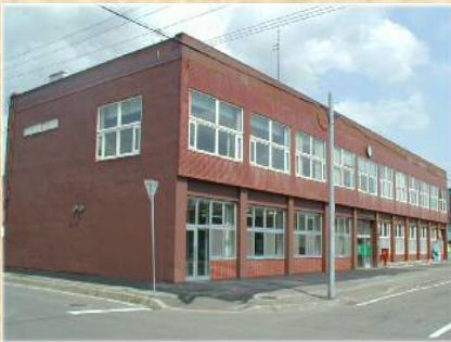
農産センター事務所