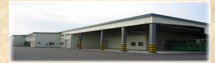
種子馬鈴薯選別貯蔵施設