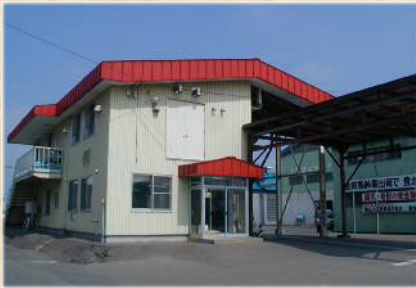
購買部 生産資材事務所