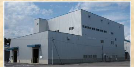
長いも・大根貯蔵施設