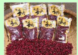
大 正 金 時