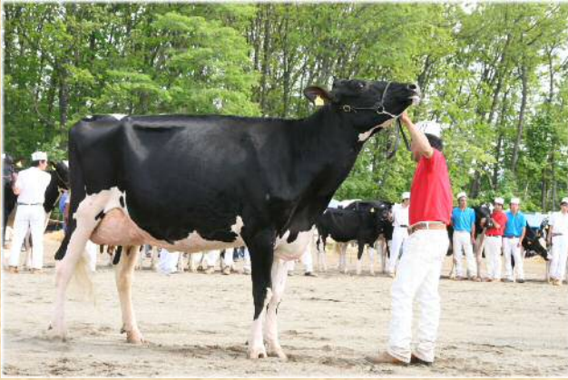
帯広ブラック&ホワイトショウ（6月上旬）