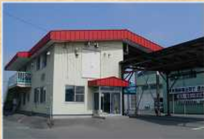
農産センター事務所