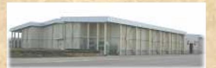
長いも・大根貯蔵施設