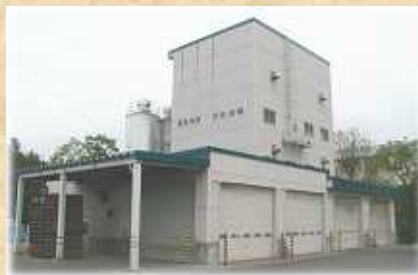
配合肥料プラント