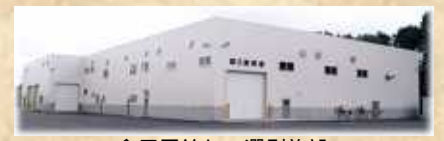
食用馬鈴しょ選別施設