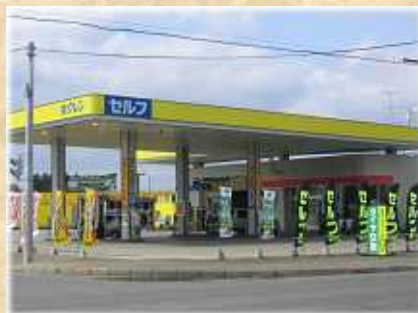
ホクレン 大正給油所 (セルフ式)