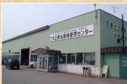
農機管理センター