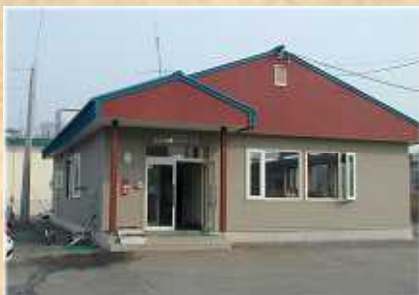
購買部 生産資材事務所