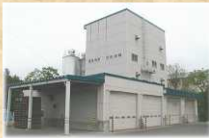
配合肥料プラント