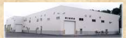
食用馬鈴しょ選別施設