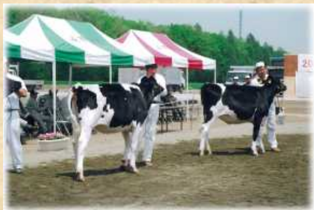
帯広ブラック&ホワイトショウ（6月上旬）